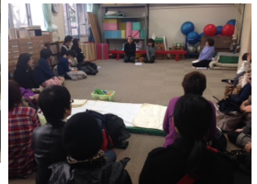
園、保育園への訪問相談の実施